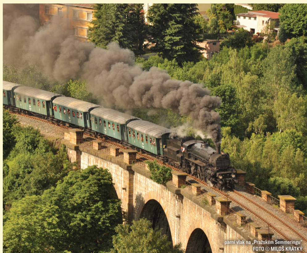
parní vlak na „Pražském Semmeringu“

Projděte se s námi historickým vlakem po nejkrásnějších tratích na území Prahy . Neopakovatelná atmosféra jízdy a jedinečné pohledy na hlavní město stojí za to!