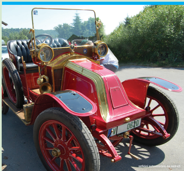
setkání autoveteránů na nádraží