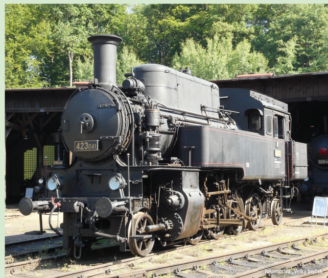
Lokomotiva „Velký hejček“